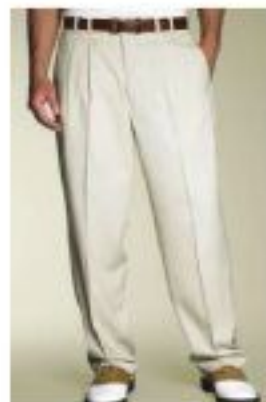
Full cut trouser