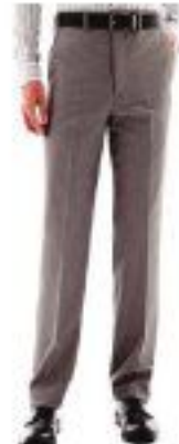
Classic Fit trouser