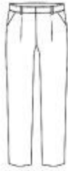
1 Pleat Side Pocket