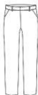
No Pleat Side Pocket