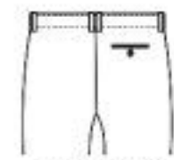
1 Back Pocket