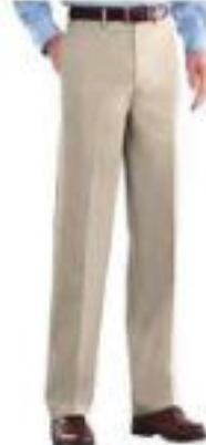
Straight cut trouser