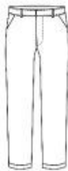
No Pleat with Double Cuff Side Pocket