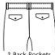
2 Back Pockets with Flaps