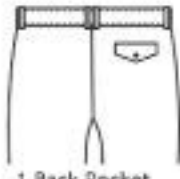
1 Back Pocket with Flap