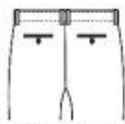
2 Back Pockets