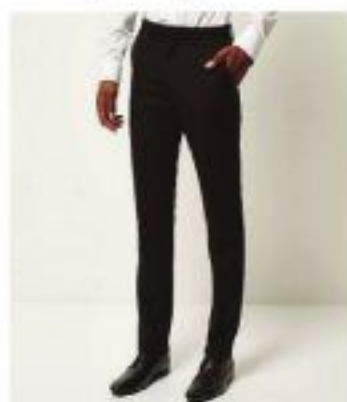
Slim Fit trouser

Put the tape straight from the back around the waist and measure the difference.