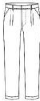
2 Pleat with Double Cuff Side Pocket